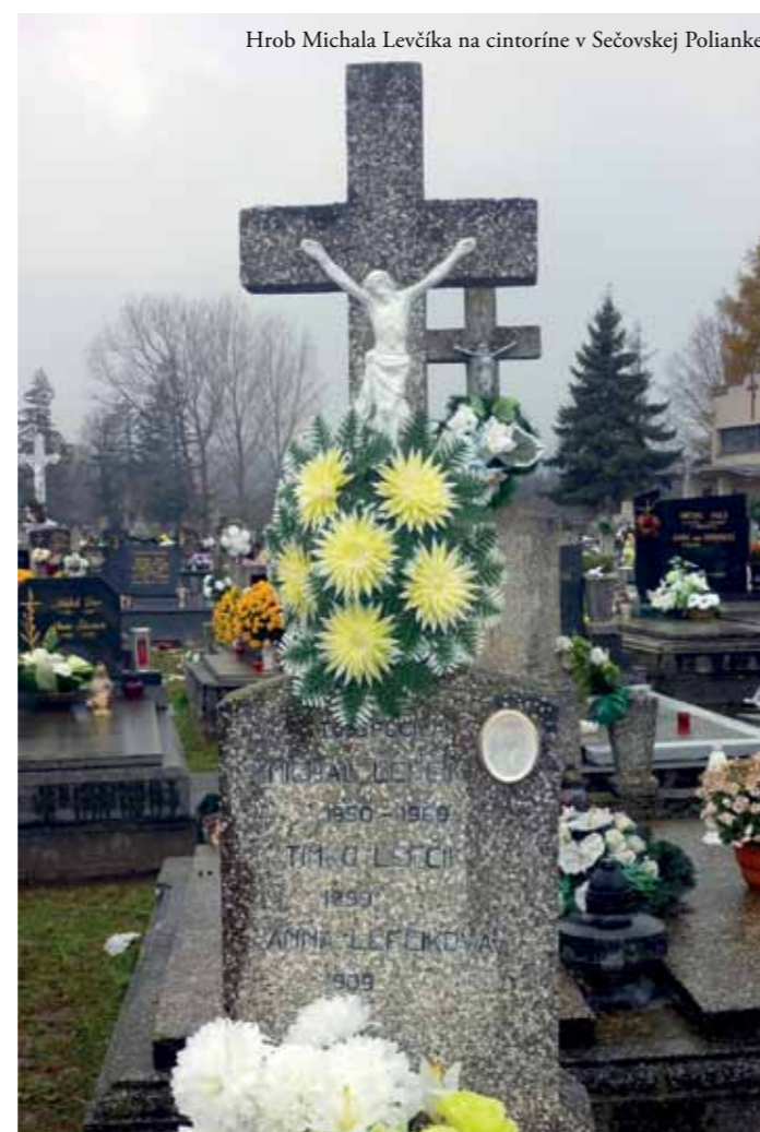
Hrob Michala Levčíka na cintoríne v Sečovskej Polianke