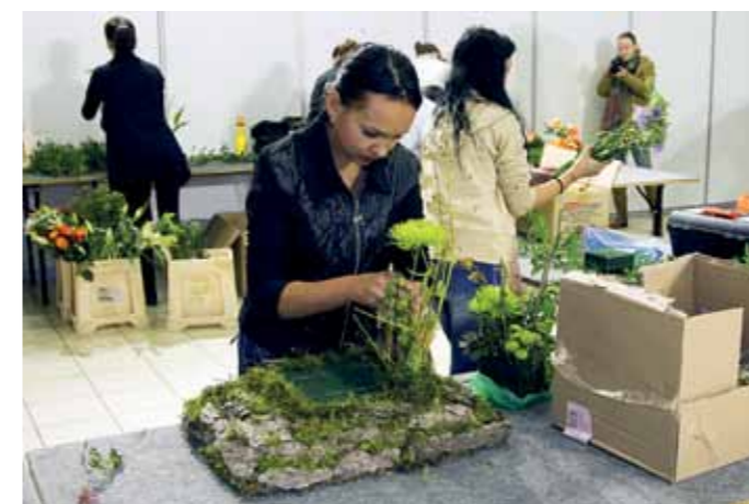
Súťaž SOŠ v aranžovaní priťahovala aj záujem médií