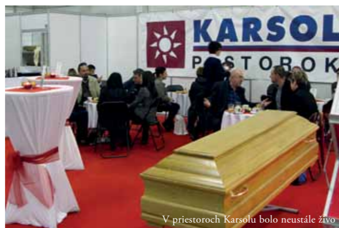
V priestoroch Karsolu bolo neustále živo