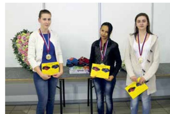
Tri zlaté medaile a vecný darček od spoločnosti New Level - športová obuv