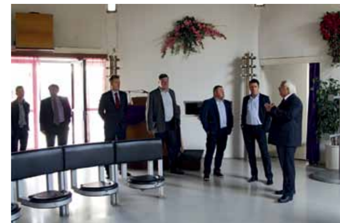
Prehliadka cintorína a domu smútku (Vrakuňa)