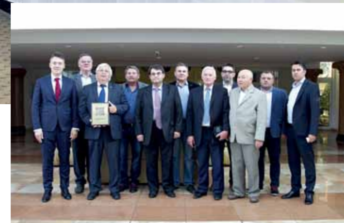
Zástupcovia z oblasti pohrebníctva zo Slovenska, Českej republiky, Maďarska a Poľska