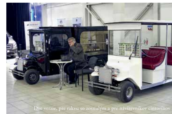
Dve verzie, pre rakvu so zosnulým a pre návštevníkov cintorínov

Firma REIMANN s. r. o. je výhradným zástupcom spoločnosti MELEX v SR a ČR, výrobcu s najdlhšou tradíciou výroby úžitkových elektromobilov v Európe. Svoju výrobu začala v roku 1971, teda funguje už viac ako 45 rokov. V ponuke majú aktuálne 40 modelov elektromobilov, pričom na trenčiansku výstavu prišli s dvomi štýlovými modelmi v retro dizajne, určenými pre pohrebné či cintorínske služby. „Obidva modely sú v retro dizajne, vzhľadom na to, že toto prostredie reaguje na klasický dizajn. Jedno z retro vozidiel je účelovo určené na prepravu rakiev a štýlovo dopĺňa celkovú atmosféru smútočného obradu, pričom je úplne nehučné. Druhé vozidlo predstavuje šesťmiestny osobný elektromobil, ktorý má trochu širšie využitie aj na cintorínoch. Pracovníci údržby sa