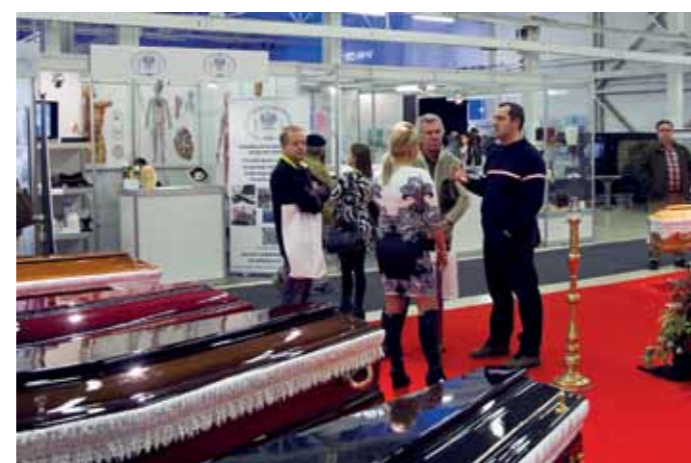
Návštevníci výstavy sa živo zaujímali o novinky

Svoje produkty a služby prišlo do Trenčína ukázať vyše 20 vystavovateľov zo Slovenska, Českej a Maďarskej republiky či Poľska. Návštevníci sa mohli, okrem iného, zoznámiť s technológiou výroby rakiev a príslušenstva, širokým sortimentom produktov na súčasnom tuzemskom aj zahraničnom trhu, prezrieť si chladiace, prepravné a manipulačné zariadenia, či hygienickú technológiu. Podľa generálneho riaditeľa