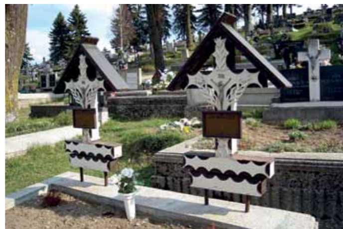
Štylizované drevené kríže. Liptovská Teplička (Poprad), r. 2009, (dátum úmrtia na kríži r. 1975)

Aké je však miesto dreva v súčasnej cintorínskej kultúre Slovenska? Na základe dlhoročných výskumov vo viacerých lokalitách možno za posledné vyše polstoročie hovoriť o radikálnom ústupe dreva z priestoru súčasných pohrebísk, výnimkou je len ústredný centrálny kríž v katolíckych cintorínoch, ktorým sa však nevenujeme. Dominantným sa stal v prípade označenia hrobu umelý alebo prírodný kameň. Vďaka svojej trvácnosti zodpovedá požiadavkám spotrebiteľov a zaručuje podstatne dlhšiu trvanlivosť ako drevo. Kamenný náhrobok s obrubou, často aj s platňami, je už niekoľko desaťročí štandardnou normou aj v vidieckom prostredí. Stal sa predmetom prestíže, posudzovania „úrovne“ rodiny, jej majetkových možností, ale aj vyjadrením úcty pozostalých voči zosnulým.