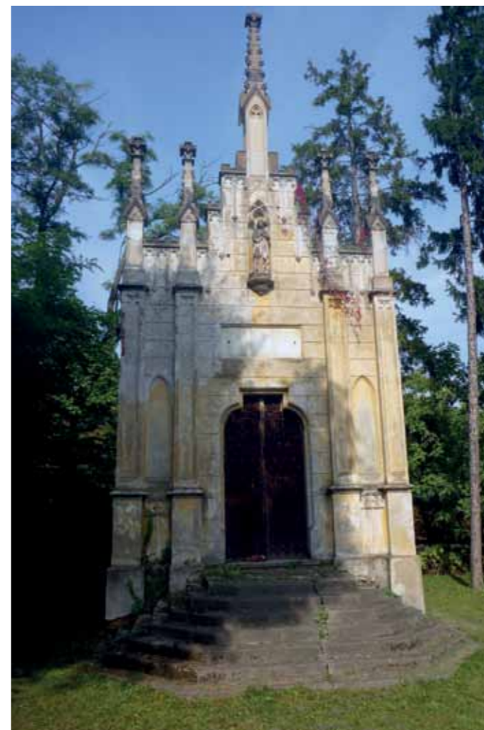
Jedna z hrobiek podobných gotickému chrámu