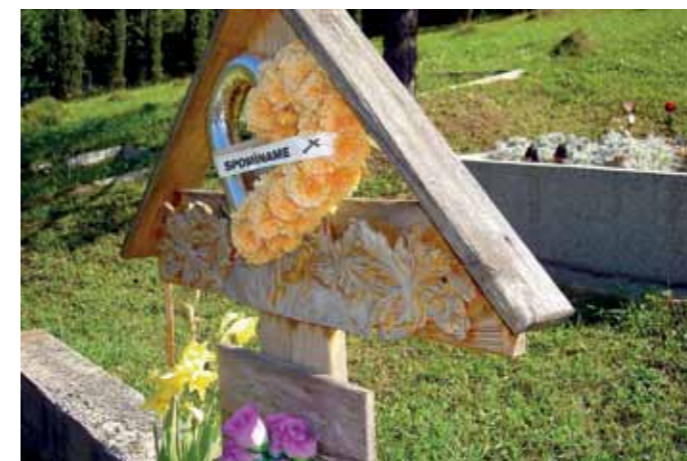
Súčasný drevený kríž, Zásكالie (P. Bystrica), r. 2009

2. Na základe zozbieraných údajov možno hovoriť o diskontinuite lokálnych tradičných foriem drevených náhrobničky, prevláda vlastná invencia a tvorivý prístup, resp. imitovanie