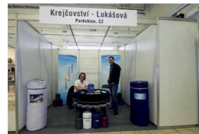
Kolegovia z Pardubic sú stálymi vystavovateľmi

Marcel Lincényi