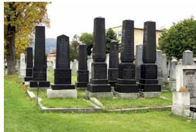
Aj tie najťažšie náhrobky sa musia opraviť