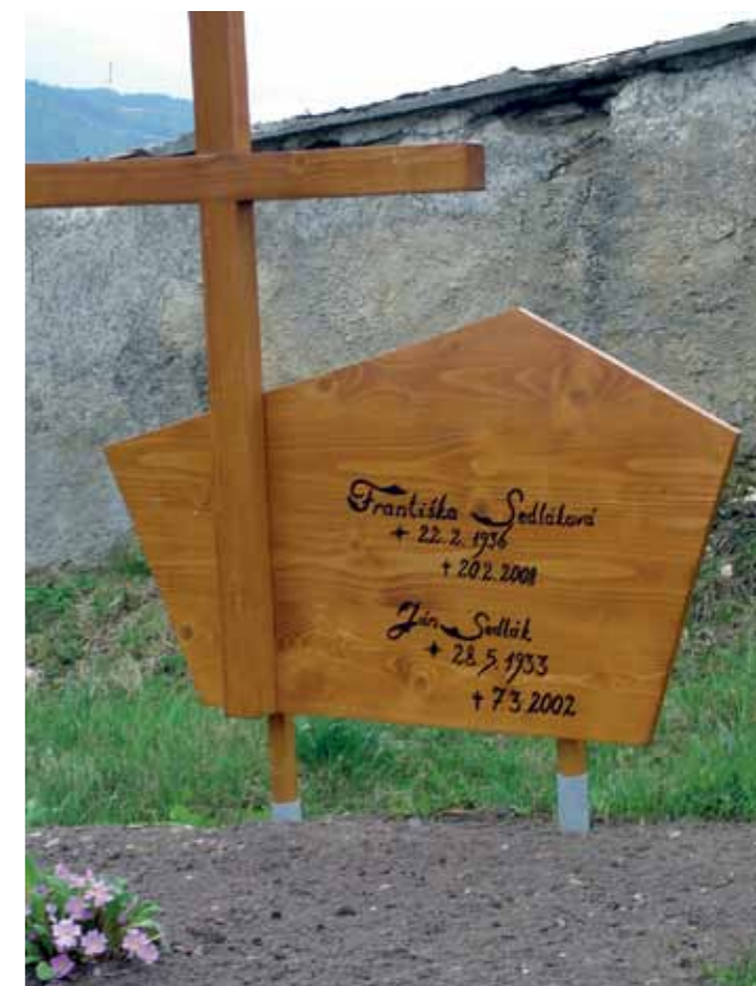
Súčasný drevený kríž, Zásكالie (P. Bystrica), r. 2009

či približovanie sa k forme súčasných kamenných náhrobničky. Ešte ku koncu 90. rokov 20. storočia sa objavovali doma vyrábané drevené kríže v tradičnej forme v horehronských skúmaných lokalitách (Šumiac a Telgárt), v súčasnosti sa však už nevyrábajú. Výnimku v tomto smere so sledovaných lokalít tvorí Detva a okolité lokality, kde by si špecifickosť situácie v danej problematike zasluhovala detailnejšiu pozornosť. Zo skúmaných oblastí ide o jediný príklad kontinuity tradičných foriem označenia hrobu, nadväzujúci a rozvíjajúci tradičné predlohy, s využitím dreveného materiálu.