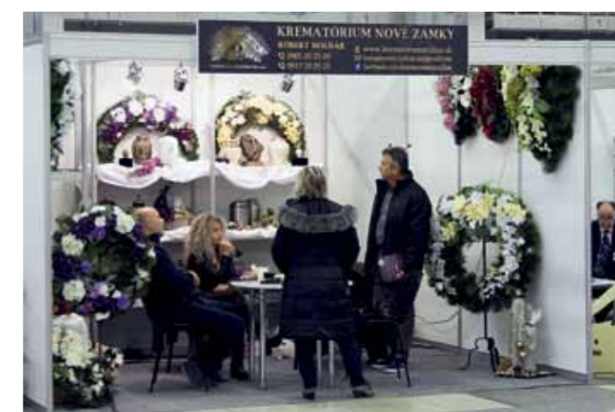
Všetko ohľadom krematória ste sa mohli dozvedieť u firmy Molnár.