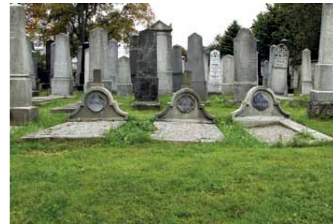
Niektoré zo starých náhrobkov sa začali prepadať

Na židovskom cintoríne v Žiline je viac ako 1 600 hrobových miest, pričom odhadujeme, že približne 80 % z nich je opustených. Je to dôsledok najmä holokaustu, kedy boli vyvraždené celé rodiny. Z tých, čo prežili, mnohí opustili