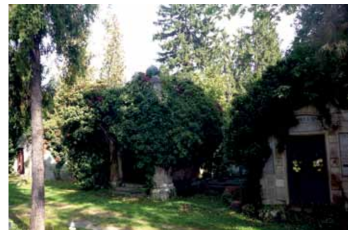
Najstaršie hroby sa nachádzajú v blízkosti kaplnky sv. Rozálie