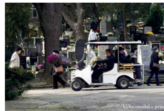
Elektromobil v praxi