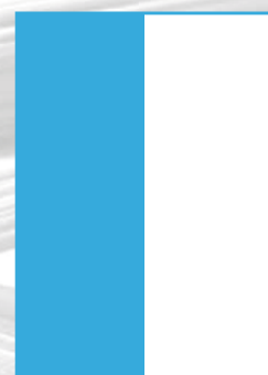
1/2 strany na výšku