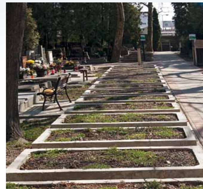
Unifikácia tvorby pohrebísk a hrobov zasiahla tak mestá ako aj dediny

manuál pre tvorbu pohrebísk a hrobových polí, ale musíme si uvedomiť, že súčasný stav cintorínskej kultúry je spôsobený okrem iného práve aj unifikáciou tvorby pohrebísk a hrobov, ktorá zasiahla v posledných desaťročiach tak mestá ako i vidiek, bez prihliadnutia k regionálnym rozdielom. Typizácia hrobov je následne kompenzovaná snahou o uplatnenie individuálneho vkusu a osobného odkazu pri úpravách hrobov a ich okolia a v konečnom dôsledku negatívne ovplyvňuje vzhľad celého pohrebiska.