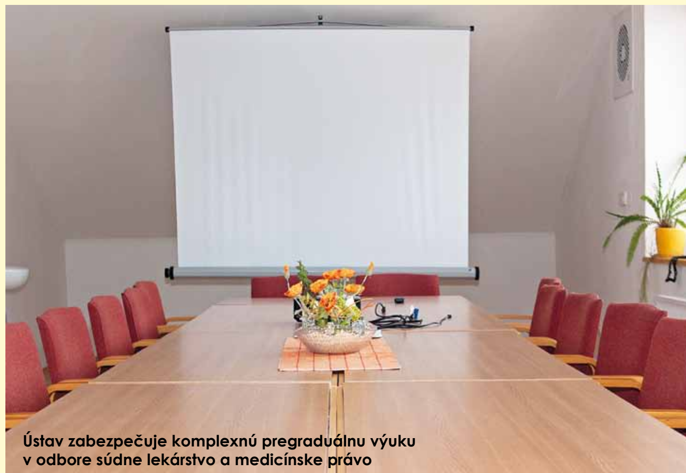
Ústav zabezpečuje komplexnú pregraduálnu výuku v odbore súdne lekárstvo a medicínske právo