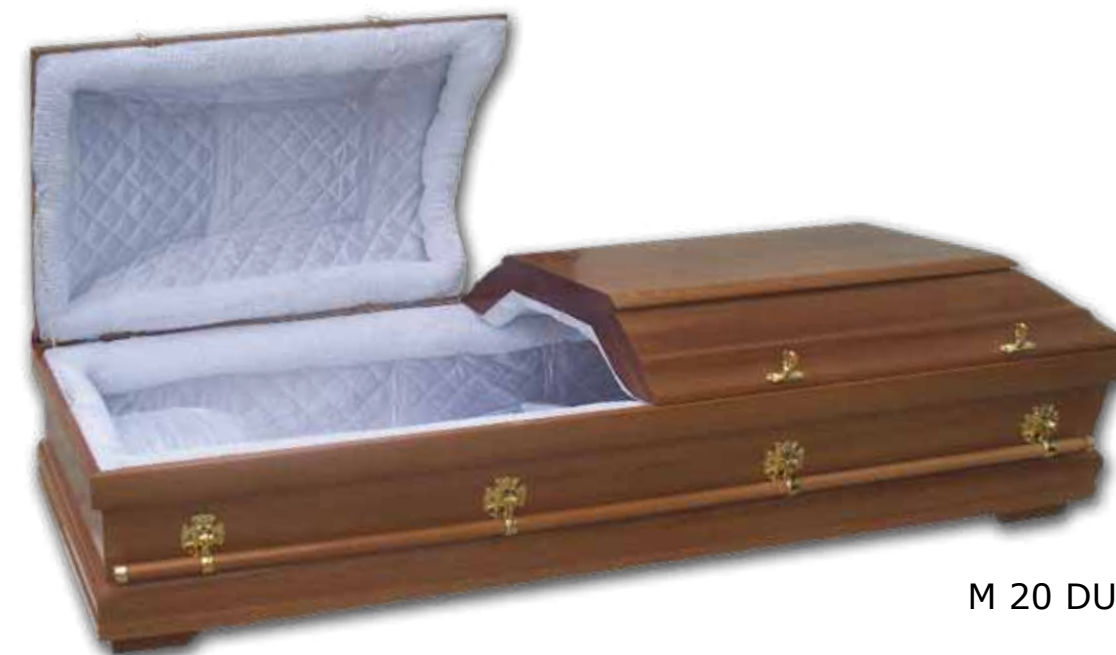
M 20 DUB