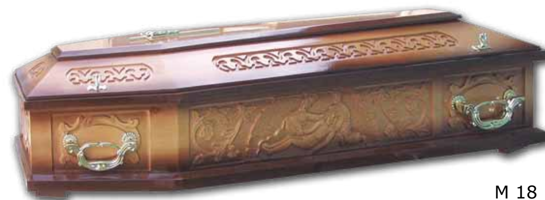
M 18 BUK