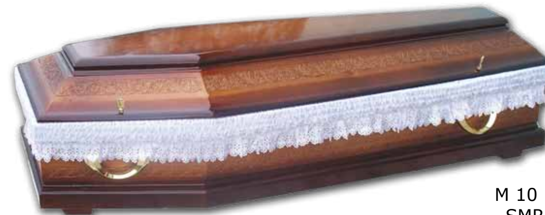
M 10 POT SMREK