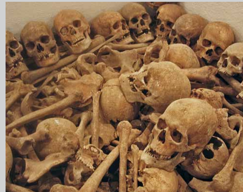
Na exhumácii sa aktívne podieľali aj miestni obyvatelia obce Osadné

Podľa záznamov z vojenských archívov bolo v roku 1933 exhumovaných 931 vojakov z vojenských cintorínov z Osadného, Nižnej a Vyšnej Jablonky a ostatky 94 vojakov exhumovaných v dňoch 13. – 17. novembra 1933 z roztrúsených hrobov lokality chotára na Skórach. Ich ostatky boli v roku 1933 uložené do jamy v krypte. Uloženie 1 025 ruských a rakúsko-uhorských vojakov pripomína tabuľa v ruštine a češtine umiestnená pri krypte.