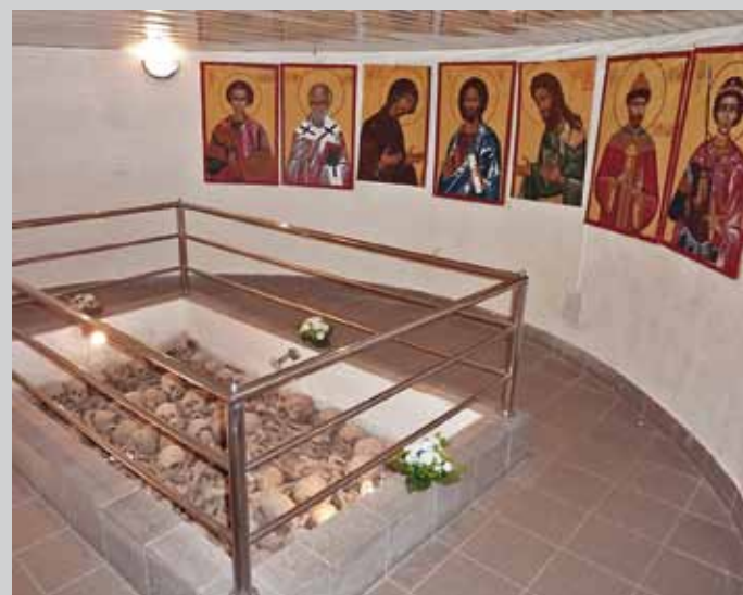
Interiér krypty a okolie bolo zrekonštruované za pomoci Veľvyslanectva Ruskej federácie, firmy Lenik a miestnych občanov v hodnote 43 152,- €

V Prahe existovala organizácia „Jednota,“ ktorá mala na starosti pochovávanie ruských vojakov a opravu ich hrobov. Jej predsedníčkou bola Naďežda Kramářová, manželka predsedu vlády ČSR Karla Kramářa. Tá miestnym veriacim poradila, aby postavili chrám ako pamätník ruským vojakom. Dokonca bola pre tento účel dňa 8. októbra 1928 Ministerstvom vnútra