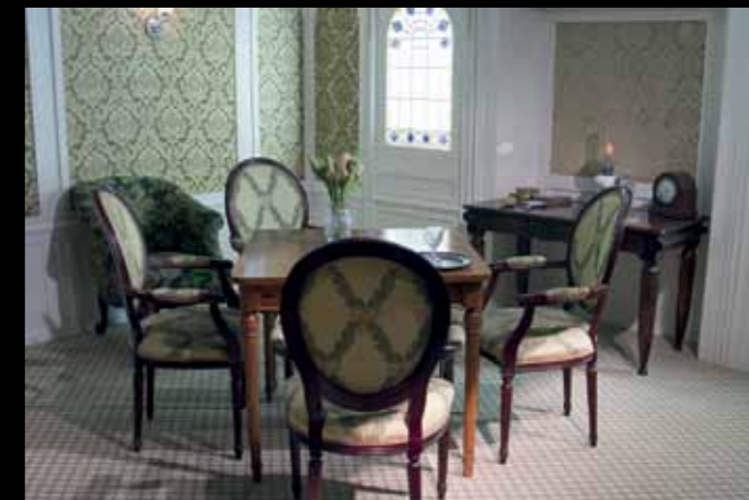
Takto vyzerala kajuta cestujúcich v 1. triede