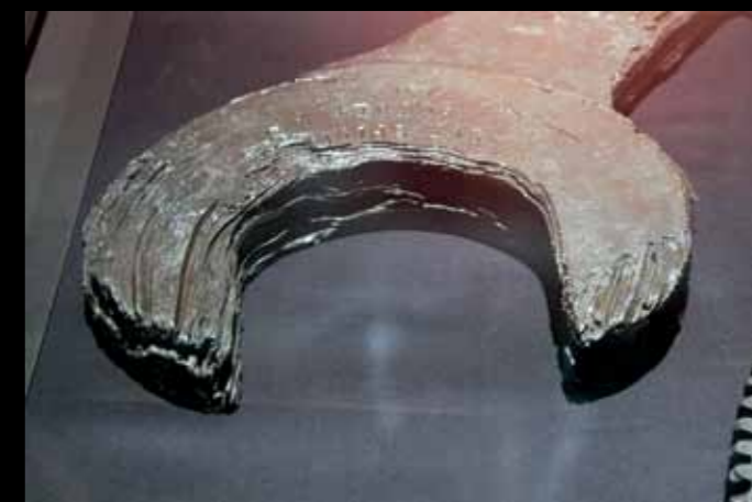
Kľúč používaný pri nastavovaní ventilov po dlhom pobyte na morskem dne

Poznámka redakcie: Kongres Spojených štátov v roku 1987 schválil zákon, ktorý okrem iného, vyzýva k rešpektovaniu vraku ako medzinárodného pamätníka a hrobu 1 538 ľudí.