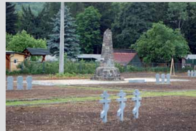
Ilustračné foto, zrekonštruovaný vojenský cintorín v Medzilaborciach