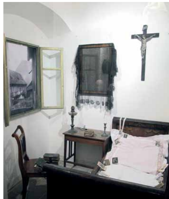
Rekonštrukcia úmrtného lôžka

Úcta preukazovaná mŕtvym novorodiatkam, prípadne deťom, ktoré bez prijatia krstu zomreli krátko po narodení, nedosahovala (najmä vo vidieckom prostredí) takú mieru, ako u dospelých. Ako na občianskych, tak na cirkevných cintorínoch, im bolo vyhrádzané zvláštne oddelenie. V mnohých prípadoch boli ešte koncom 19. storočia pochovávané do neoznačených hrobov, bez patričnej rozlúčky a smútočných obradov. Za „zlú smrť“ bola v minulosti považovaná tiež smrť neznámeho človeka. Až do konca 18. storočia bolo s takými zosnulými nakladané veľmi nedôstojným spôsobom. Veľakrát nebolo možné ich pochovať na „posvätné pôde“ a bolo s nimi preto zaobchádzané rovnako ako so samovrahmi či odsúdencami. Ich tiel sa ujímali tzv. pohodní (excoriatori), čiže ľudia, ktorí sa zaoberali v minulosti likvidáciou uhynutých zvierat. Nezriedka ich pochovávali na odlahlých, k tomu určených miestach na hraniciach katastrov obcí, mimo mestských hradieb. Nariadenia Jozefa II., ktoré vyčleňovali popraveným a samovrahom nedôstojné miesta na cintorínoch, boli dlhý čas predmetom značného odporu