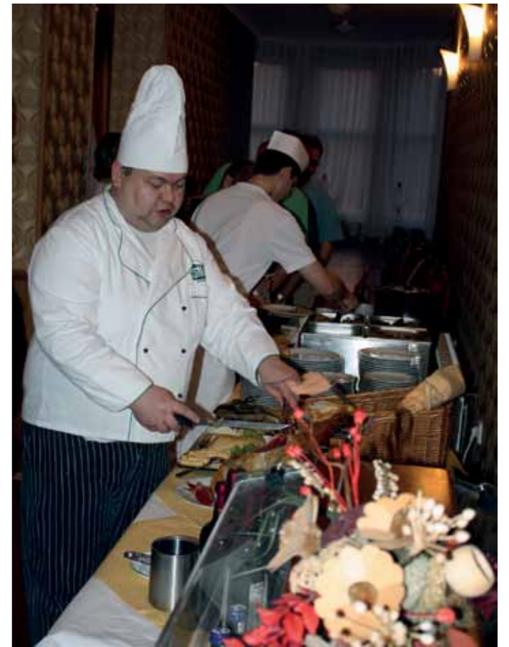
Ilustračné foto Pavel Ondera

Počet účastníkov karu závisel od viacerých skutočností – vek zosnulého (najväčší počet v prípade zosnulého v produktívnom veku), početnosť príbuzenstva, počet známych, ale aj od miestnych zvykov, obľúbenosti zosnulého, finančných možností pozostalých. Spravidla počas vychádzania z cintorína muž z okruhu najbližšieho príbuzenstva pozýval a podnes pozýva vybraných účastníkov na kar. Inde sa pozvanie realizuje ešte na cintoríne pri hrobe zosnulého, kde niekto z príbuzných poďakuje za účasť a v mene pozostalých pozýva účastníkov pohrebu na kar. Pri takomto „všeobecnom“ type pozvania je už na samotných účastníkoch pohrebu, či sa karu zúčastnia, čo záleží od miestnej etikety, stupňa príbuzenstva, vzťahu k zosnulému, jeho rodine, resp. aj vzdialenosti, ktorú museli