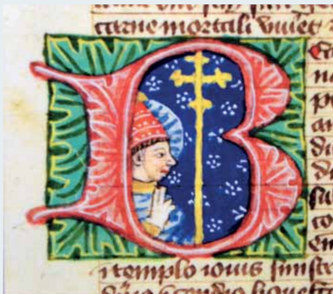
sv. Kalixt I. (Kalist I.) – svátek 14. října

Antonín Veliký [online]. 2015. Dostupné z https://cs.wikipedia.org/wiki/Antonín_Veliký [cit. 2015 – 08 - 16]. Antonín Veliký [online]. 2015. Dostupné z http://catholica.cz/?id=220 [cit. 2015 – 08 - 16]. Église Saint Julien [online]. 2015. Dostupné z https://fr.wikipedia.org/wiki/Église_Saint-Julien_(Arles) [cit. 2015 – 08 - 16]. Svátý Antonín [online]. 2015. Dostupné z http://www.acizek.nfo.sk/teolog/saints/texty/01/17antonin.htm [cit. 2015 – 08 - 16]. Josef z Arimatie [online]. 2015. Dostupné z https://cs.wikipedia.org/wiki/Josef_z_Arimatie [cit. 2015 – 08 - 16]. Svátý Kalixt I. [online]. 2015. Dostupné z http://www.abcsvatych.com/mesice/a10/rijen14.htm [cit. 2015 – 08 - 16]. Kalixtovy katakomby [online]. 2015. Dostupné z https://cs.wikipedia.org/wiki/Kalixtovy_katakomy [cit. 2015 – 08 - 16]. Svátý Kalixt [online]. 2015. Dostupné z http://catholica.cz/?id=4782 [cit. 2015 – 08 - 16]. Svátá Barbora [online]. 2015. Dostupné z http://catholica.cz/?id=4865 [cit. 2015 – 08 - 16]. Barbora [online]. 2015. Dostupné z http://www.acizek.nfo.sk/teolog/saints/texty/12/04barbora.htm [cit. 2015 – 08 - 16]. Via Appia [online]. 2015. Dostupné z https://cs.wikipedia.org/wiki/Via_Appia [cit. 2015 – 08 - 16]. Barbora z Nikodémie [online]. 2015. Dostupné z https://cs.wikipedia.org/wiki/Barbora_z_Nikomédie [cit. 2015 – 08 - 16].