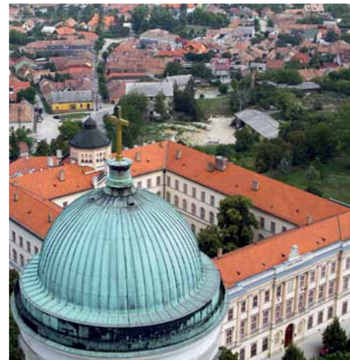
V tejto časti komplexu ostrihomskej Katedrály bude prebiehať Druhý ročník konferencie štátov V4 o pohrebníctve

Pohrebníctvo Ecker Kompletné pohrebné služby