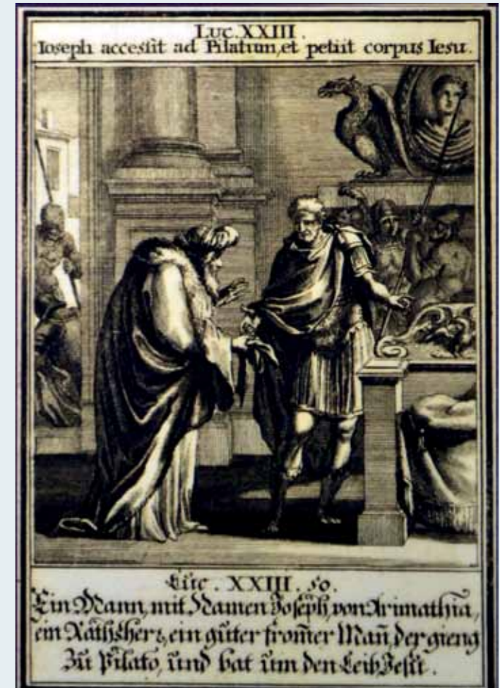
Ilustrace, Jozef z Arimatie žádá o tělo Ježíšovo Ján 19:38 Potom pak prosil Piláta Jozef z Arimatie, (kterýž byl učedník Ježíšův, ale tajný, pro strach Židovský), aby snal tělo Ježíšovo. I dopustil Pilát. A on přišel, i snal tělo Ježíšovo. 39 Přišel pak i Nikodém, (kterýž byl prve přišel k Ježíšovi v noci), nesa smíšený mirry a aloes okolo sta liber. 40 Tedy vzali tělo Ježíšovo, a obvinuli je prostěradly s vonnými věcmi, jakž obyčej jest Židům se pochovávat. 41 A byla na tom místě, kdež ukřižován byl, zahrada, a v zahradě hrob nový, v němžto ještě žádný nebyl pochován. 42 Protož tu pro den připravování Židovský, že blízko byl hrob, položili Ježíše.