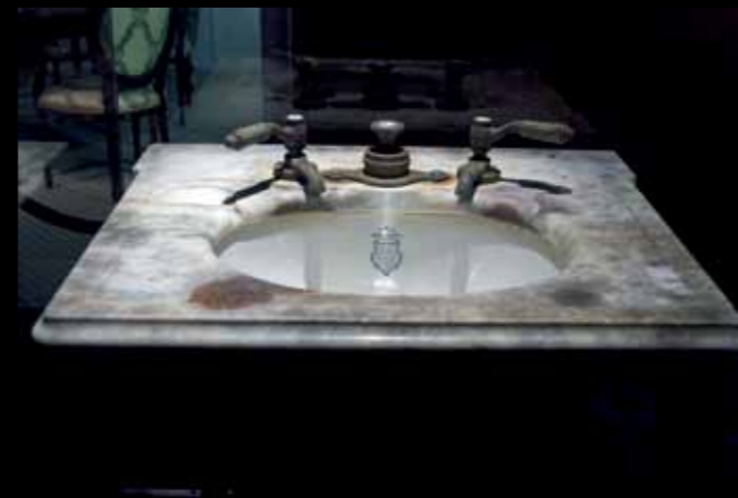
Umývadlo vyťahnuté z vraku lode