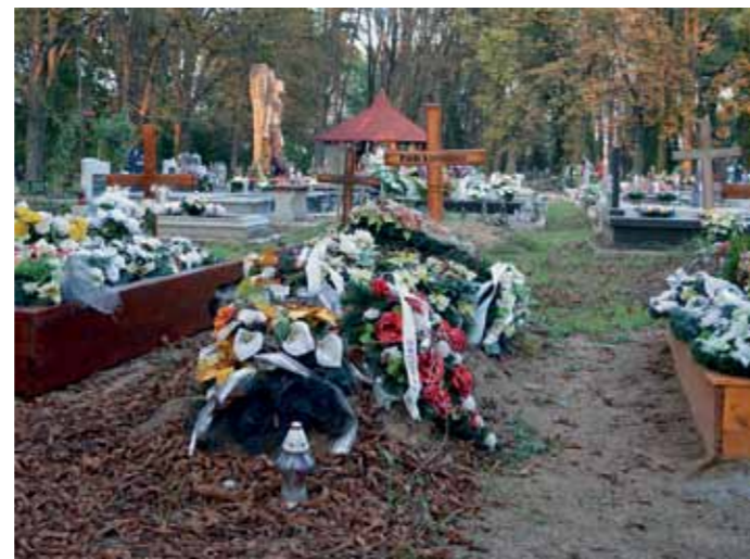
Hore cintorín, kde k zámene prišlo, dole miesto posledného odpočinku Pavly K.