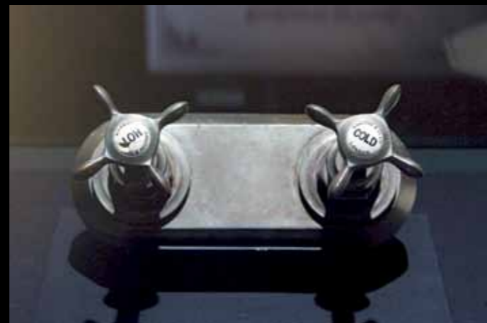
Teplá a studená