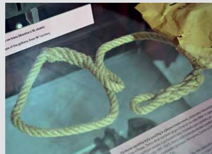
Tieto slučky sa používali do roku 1954. Vystavené v Národnom muzeu v Prahe počas trilógie výstavy Smrt.

Po roku 1945 nebolo právo cestovať do zahraničia obnovené v predvojnovom rozsahu, a to hlavne z politických a ekonomických dôvodov. K ešte väčšiemu sprísneniu tohto práva došlo po roku 1948. Zatiaľ, čo do októbra 1948 sa prechod štátnej hranice bez pasu považoval len za priestupok, tak po tomto dátume to už bol trestný čin s najvyššou sadzbou päť rokov odňatia slobody. Z dôvodu, aby občania nemohli uniknúť do demokratických štátov, sa postupne uzavreli juhozápadné hranice s Nemeckou spolkovou republikou a Rakúskom, ktoré strážila Pohraničná stráž. A tu postupne začalo dochádzať k prípadom usmrtenia osôb, ktoré sa túto hranicu snažili prekročiť. Výskum v tejto problematike sa mohol samozrejme začať až po roku