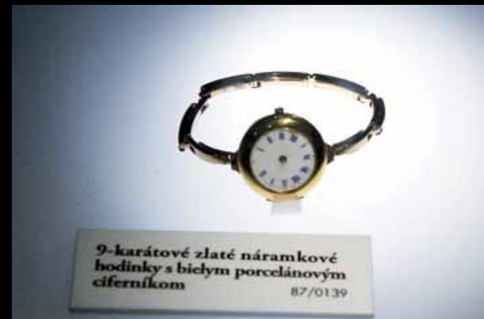
Hodinky vyťahnuté z vraku lode