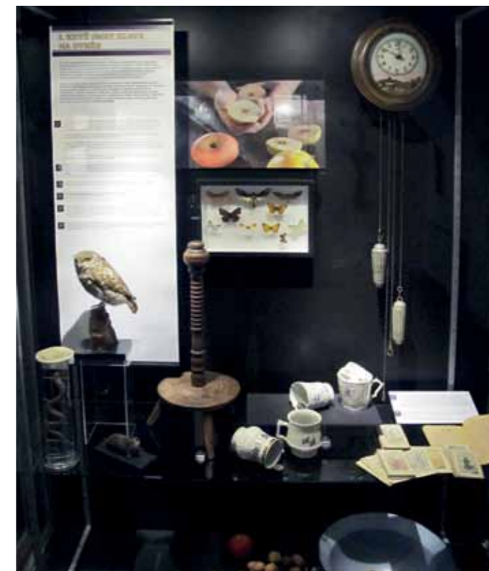
Časť výstavy spojená s predpovedaním blížiacej sa smrti